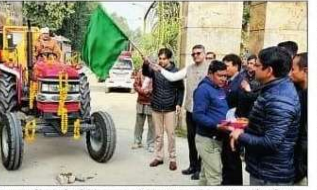
सक्छन मरीन को हरी झंडी दिखा रवाना करते निगम आयुक्त और रबर प्लांट के अधिकारी। संब्यन